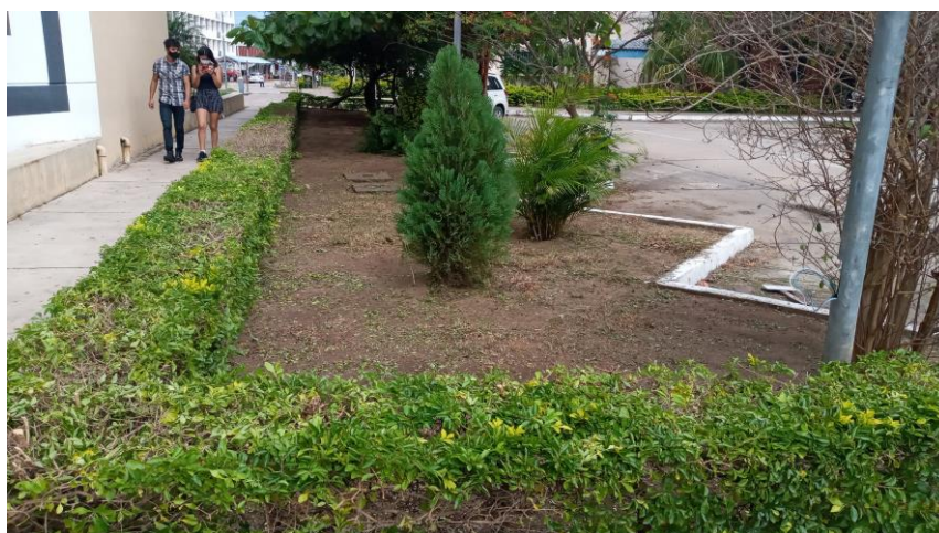
Trabajo concluido de las áreas verdes